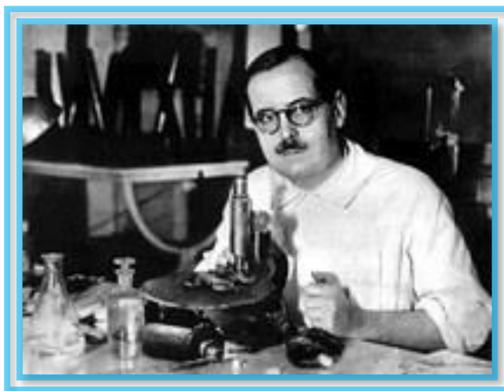
Dr. Bernardo Houssay (1887-1971)

Para esta fecha se eligió el día del nacimiento del doctor Bernardo Houssay (1887-1971), eminente científico argentino cuya trayectoria marcó un punto de inflexión en el desarrollo de la ciencia en el país.