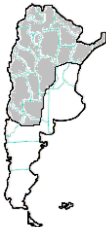
MAPA n° 2 Bothrops neuwiedi diporus Yarará chica