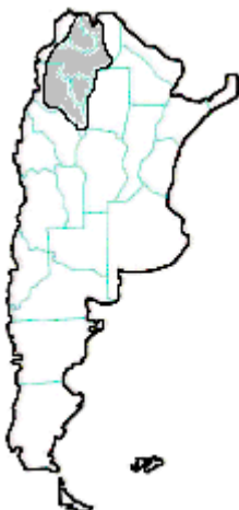
MAPA n° 11 Tityus confluens