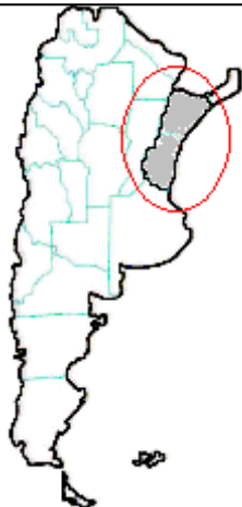
MAPA n° 5 Micrurus balyocorhipus