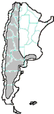
MAPA n° 3 Bothrops ammodytoides – Yarará ñata