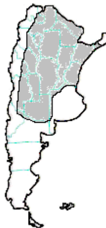
MAPA n° 6 Micrurus pyrrhocryptus