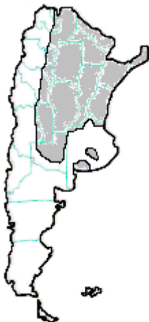
MAPA n° 1 Bothrops alternatus Yarará grande