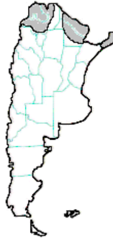
MAPA n° 12 Phoneutria