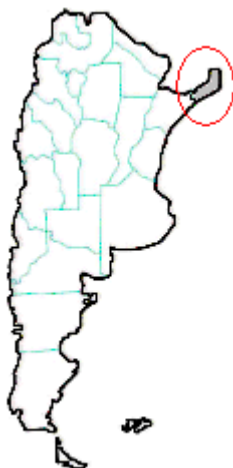
MAPA n° 7 Micrurus altirostris , Micrurus corallinus